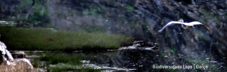
Biodiversidade Lapa | Garça