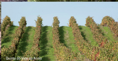
Quinta do Vale do Armo