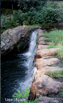
Lapa | Açude