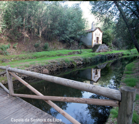
Capela da Senhora da Lapa